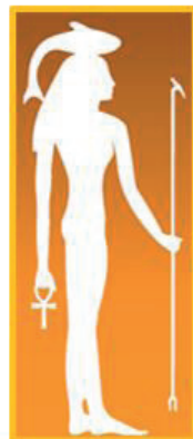
Tier: Fisch Göttin: Hatmehit