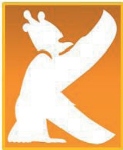
Tier: Geier Göttin: Nechbet

AUFGABE 3: (Die Namen der Götter musstest du nicht herausfinden. Wir haben sie dazugeschrieben, damit du nochmal selbst recherchieren kannst, wenn du dich näher mit den einzelnen Gotttheiten beschäftigen möchtest.)